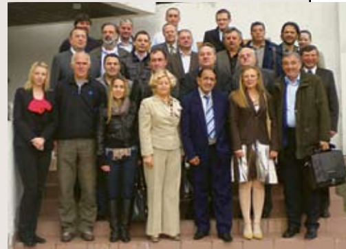
Sudionici skupa u Begovom Razdolju

U hotelu "Jastrebo" u Begovom Razdolju je od 20. do 23. svibnja održan trinaesti po redu tradicionalni znanstveni međunarodni skup "Nacionalne manjine u demokratskim društvima". Skup, čiji su organizatori Centar za međunarodne i sigurnosne studije Fakulteta političkih znanosti u Zagrebu i Savjet za nacionalne manjine RH održan je pod visokim pokroviteljstvom predsjednice Vlade Jadranke Kosor .