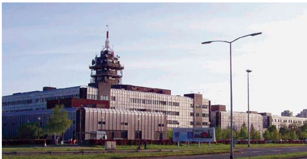
Na Prisavljju još nije nestao govor mržnje