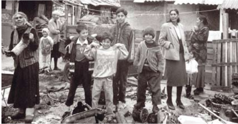
Romskoj manjini konstitutivni status znači više nego drugima zbog socijalne isključenosti

Načelo razmjerne zastupljenosti u tijelima lokalne i regionalne samouprave, ondje gdje manjina čini više od 15 posto stanovništva, zapravo je ostvarivanje načela konsocijacijske izgradnje institucija u pluralnim lokalnim zajednicama. To se načelo pokazuje učinkovitim zato što nadomješta većinsko načelo, po kome pluralne zajednice jednostavno ne mogu funkcionirati. Naime, kad se neka zajednica sastoji od dviju ili više nacionalnih skupina, ne smije se dopustiti da ona relativno veća prigrabi sve funkcije vlasti, kao što bi to mogla po većinskom načelu, već obje skupine moraju preuzeti suodgovornost za upravljanje zajednicom. Formiranje izvršne vlasti u kojoj je, sukladno Ustavnom zakonu, u općinskim, gradskim, odnosno županijskim, poglavarstvima morala biti uspostavljena zastupljenost manjine, vodila je prema stvaranju konsocijacijske političke kulture. Zato postoji golema opasnost da bi ukidanjem poglavarstava te neposrednim