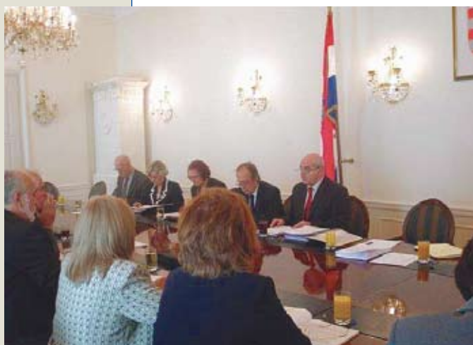
Savjet za nacionalne manjine je radi štednje otkazao ovogodišnju manifestaciju “Kulturno stvaralaštvo nacionalnih manjina” te je smanjio sredstva za poslovanje stručne službe Savjeta