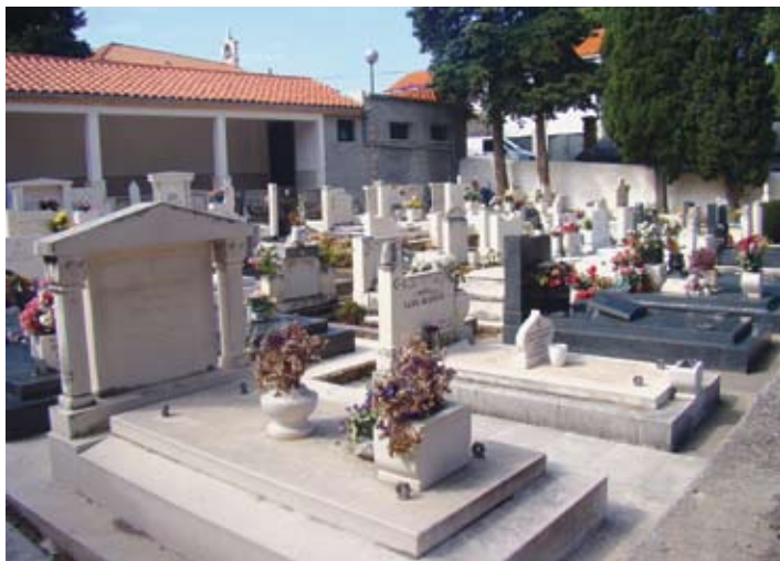
Na dijelu Boninova za pripadnike islamske zajednice (na slici) je i spomen-ploča za 23 Bošnjaka koji su poginuli u obrani Dubrovnika

Dok većini smrtnika na ovom svijetu smrt znači mir - dubrovačkim muslimanima, najvećim dijelom Bošnjacima, ona znači novo putovanje. Ne samo na drugi svijet nego i u drugu zemlju. Putovnica im vrijedi i nakon datuma smrti. Zemlja Hrvatska u svom tankom, najjužnijem dijelu, tijesna je za svoje građane koji bi umjesto križa na grob stavili nišan pa im na putu za ahiret valja u Bosnu i Hercegovinu. I ni po jada da mogu na mezarje sa svojim precima. Ne ide ni to jer preci dubrovačkih Bošnjaka su se spustili iz zaleđa Grada, kao Držičev stari trgovac Stanac, iz istočne Hercegovine, iz Gackog, Trebinja, Bileće, Nevesinja, Ljubinja koji su danas, nakon zadnjeg krvavog miješanja karata, u Republici Srpskoj, a tamo - odakle se na njih žive pucalo - dubrovačkim muslimanima se ni mrtvima ne vraća. Sve dok se ne vrate živi istočnohercegovački Bošnjaci. Dvostrukim prognanicima u smrti - iz mjesta u kojem su rođeni i živjeli i iz prazavičaja - dženaza mimo njihove zbiljske volje bude u onom dijelu Bosne i Hercegovine koji se zove Federacijom BiH, najčešće na mostarskom groblju Sutina, svojih 150 kilometara od Dubrovnika, a znaju u mrtvačkim