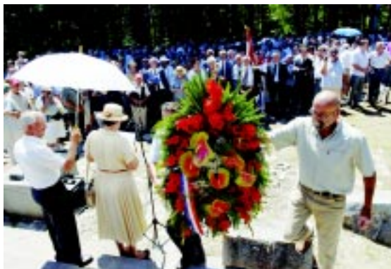
Proslava u Srbu